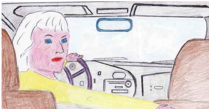
SGUARDO DI SICUREZZA ALL'INDIETRO (es. parcheggio, retromarcia)

In caso di grave artrosi della colonna vertebrale, consiglio di far controllare ad un medico, a scadenza regolare, l'idoneità alla guida.