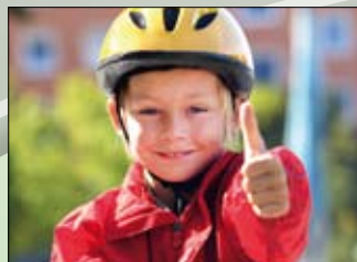
MINI CORSI DI ESERCITAZIONI RIVOLTE AGLI ADULTI DI DOMANI