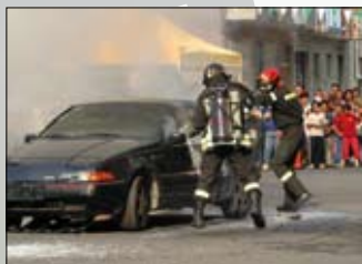
SIMULAZIONE DI UN INTERVENTO DI SOCCORSO