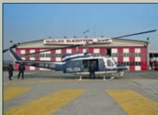
PRESENZA DI MEZZI DI SOCCORSO DEGLI ENTI PREPOSTI PER LA SICUREZZA STRADALE