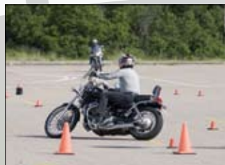
PRESENTAZIONE DI CORSI GUIDA SICURA IN MOTO